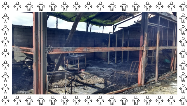
Le 26 avril dernier, un incendie s'est déclaré dans une dépendance de la ferme du Moulin qui a été circonscrit par les pompiers de Chaource et de Tonnerre et occasionnant des dégâts matériels