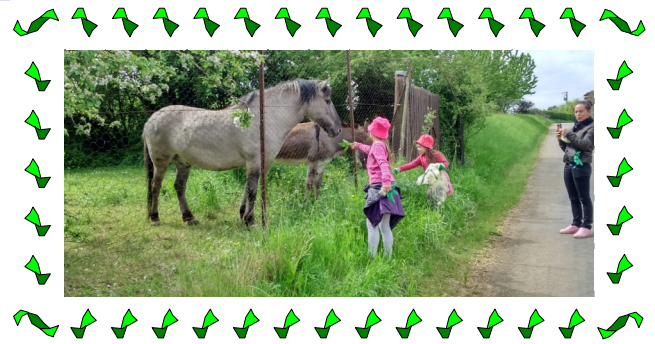
La matinée printanière « Nettoyage de la nature » permet aussi de belles rencontres