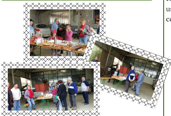
Après l'effort, le réconfort....

Un corps sain dans un environnement sain